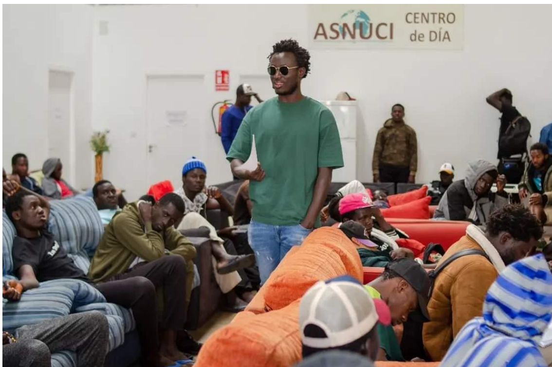
Fotografía 6. Asamblea general en Centro de Día de ASNUCI 20.05.2024.