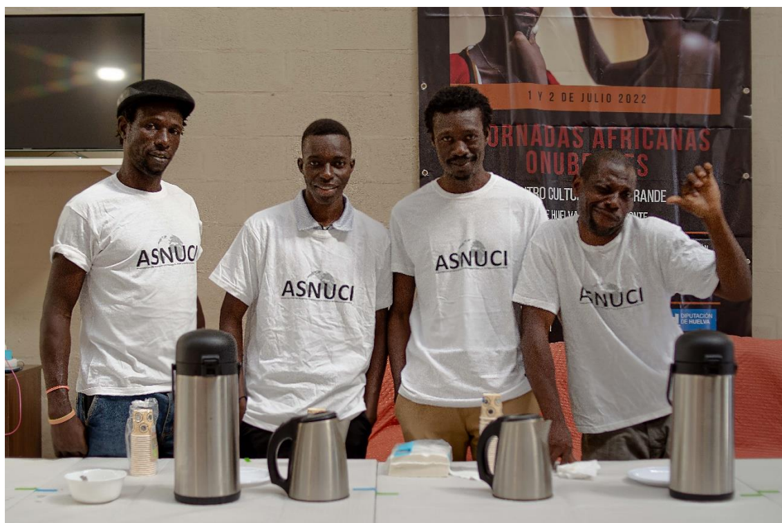
Fotografía 20. Parte del equipo voluntario de ASNUCI en el Centro de Día 22.10.2024.

El funcionamiento diario del Centro de Día se sostiene gracias a la implicación directa de personas voluntarias que ejercen labores de cuidado y gestión del espacio. Estas personas cuidadoras, en coordinación con el equipo técnico, se encargan de abrir el recurso, recibir a las personas usuarias, regular el uso de duchas y lavandería y mantener el orden y la limpieza del espacio común. Este modelo refuerza el carácter autogestionado y comunitario del recurso.