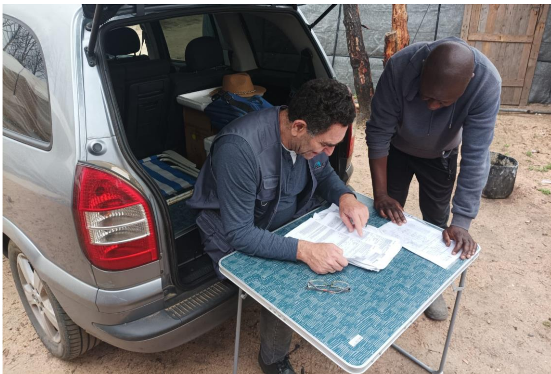
Fotografía 19. Atención jurídica en asentamiento Lucena del Puerto (Huelva) el 21.03.2024.