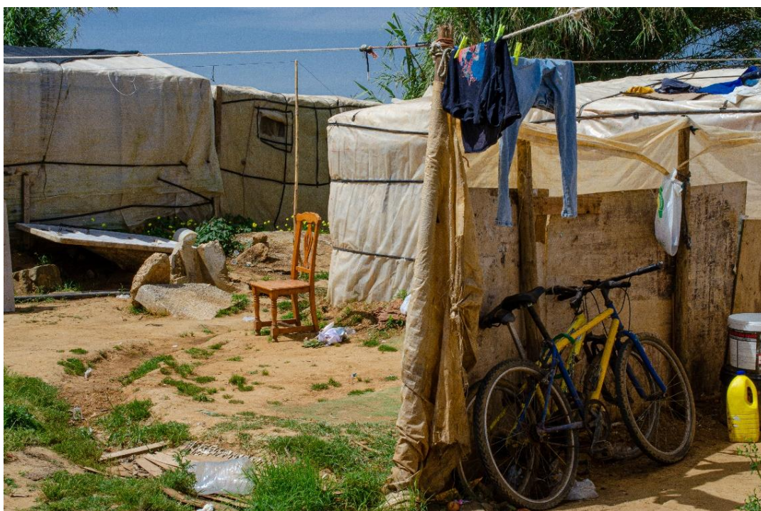
Fotografía 2. Asentamiento chabolista Campo de Fútbol (Lepe) 17.04.2024.

La falta de alojamiento digno, los problemas de empadronamiento, las barreras idiomáticas y la irregularidad administrativa dificultan el acceso a los derechos básicos: vivienda, salud, empleo o formación.