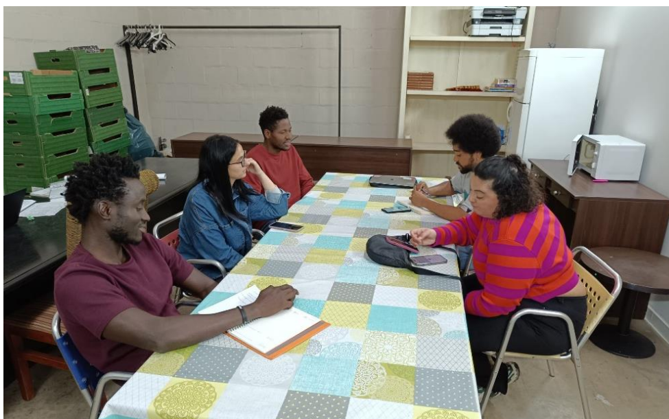
Fotografía 10. Reunión con (Des) bordando Democracia en sede de ASNUCI 25.03.2024.

Este espacio impulsa una mirada amplia, diversa y transformadora de la democracia, fomentando la articulación colectiva y la acción política desde las bases sociales.