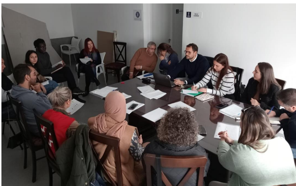
Fotografía 9. Reunión Mesa de Coordinación Asentamientos de Lepe 02.04.2024.

Gracias a esta participación, ASNUCI ha contribuido de forma activa a fortalecer la colaboración institucional y comunitaria en Lepe, reforzando su papel como entidad de referencia en la atención y acompañamiento a personas en situación de exclusión habitacional.