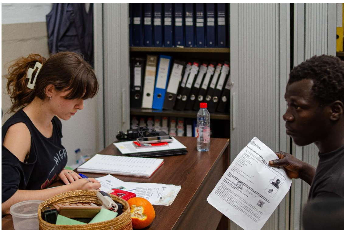
Fotografía 11. Atención social y administrativa en Centro de Día de ASNUCI 17.04.2024.

En conjunto, el proyecto superó ampliamente los objetivos previstos, garantizando el acceso efectivo a derechos básicos, promoviendo la igualdad de trato y fortaleciendo las redes de apoyo comunitario en la provincia de Huelva.