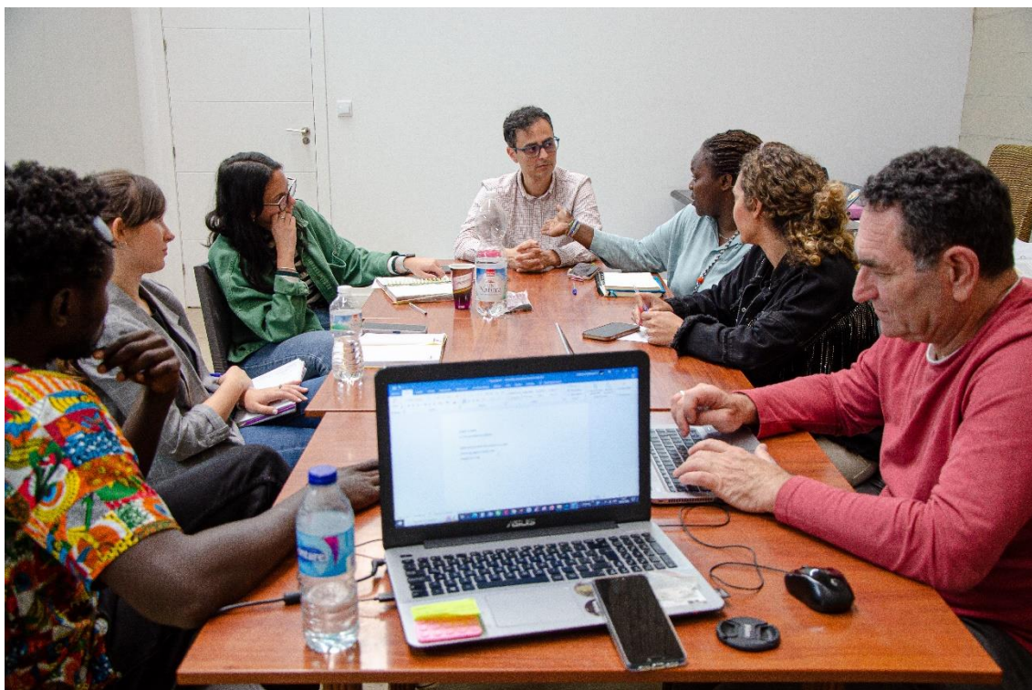
Fotografía 7. Reunión de coordinación equipo técnico de ASNUCI 19.04.2025.

El equipo técnico mantiene reuniones periódicas de trabajo y coordinación con la Junta Directiva, garantizando la coherencia de las actuaciones, la evaluación continua de los proyectos y la mejora constante de la calidad de los servicios ofrecidos.