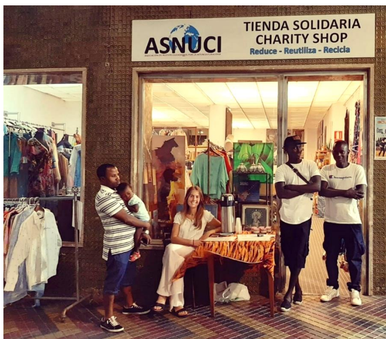
Fotografía 5. Tienda de segunda mano de ASNUCI y voluntariado 2019.