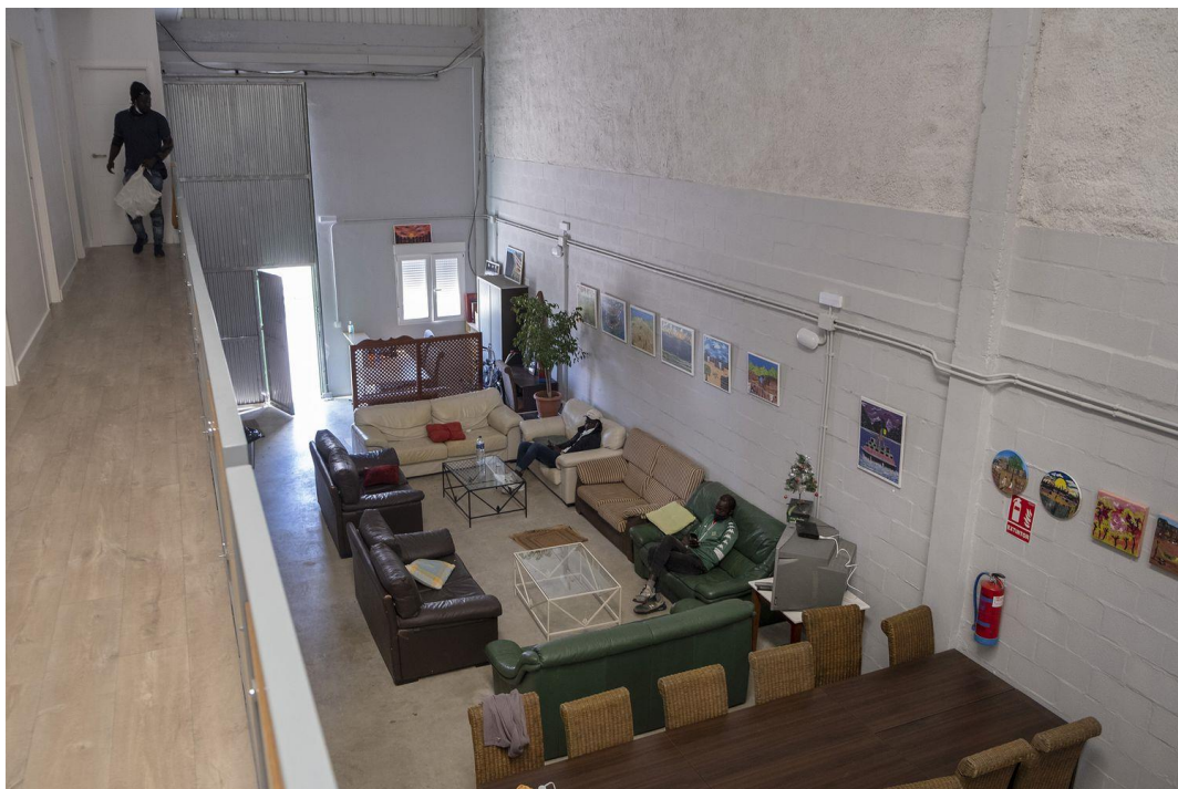
Fotografía 4. Alojamiento Colectivo Temporal de ASNUCI 2021.