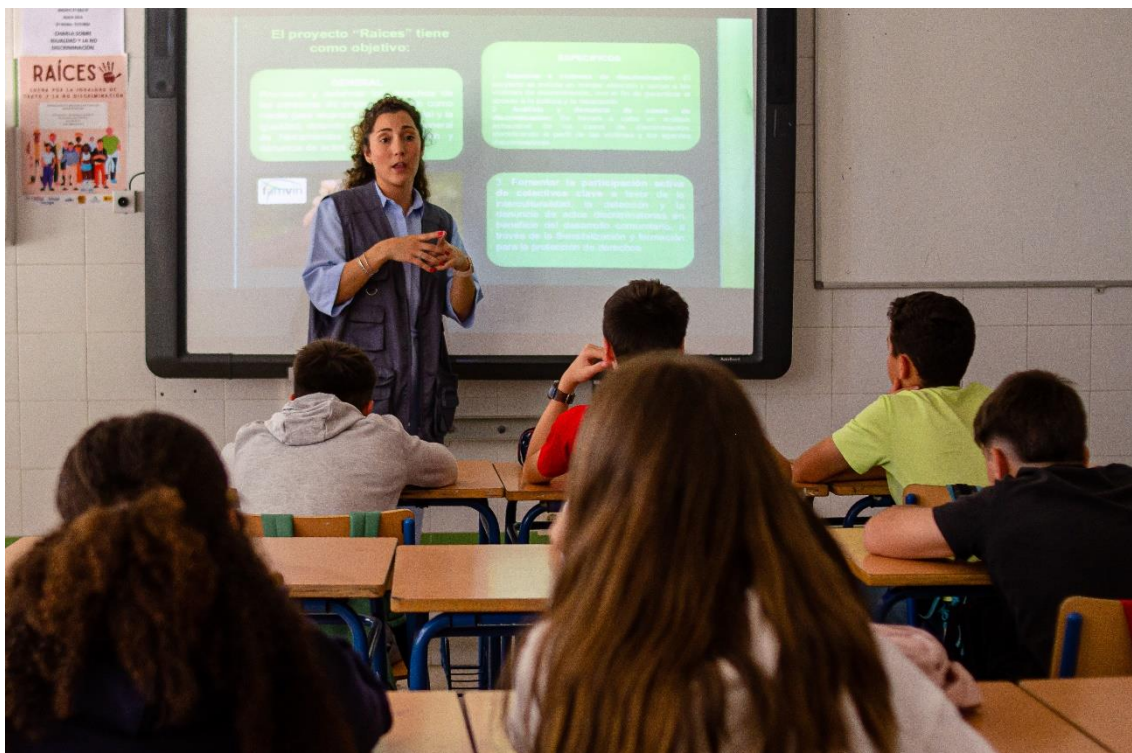
Fotografía 15. Taller de sensibilización sobre diversidad e igualdad de trato en IES Guadiana de Ayamonte (Huelva) 08.05.2025.