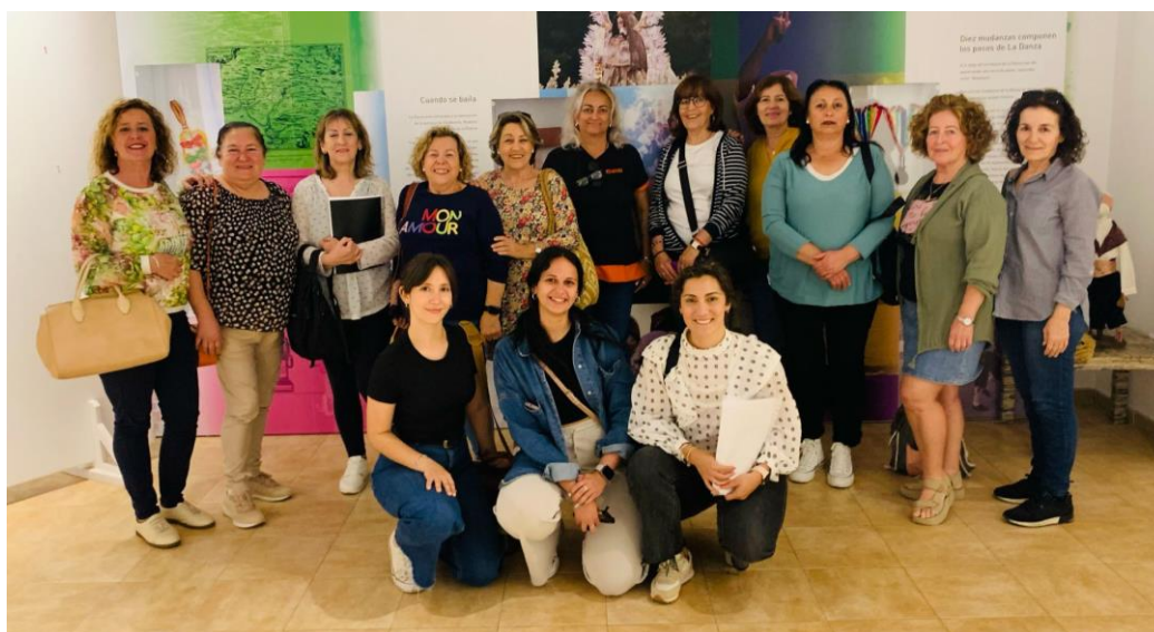
Fotografía 14. Microformación en materia de Trata de Seres Humanos a asociación de mujeres Atardecer de Villablanca (Huelva) 15.04.2025.

El proyecto ha permitido generar espacios seguros de información, confianza y participación, fortaleciendo la conciencia colectiva sobre la trata como una grave violación de los derechos humanos y promoviendo una cultura basada en la igualdad, la dignidad y la justicia social.