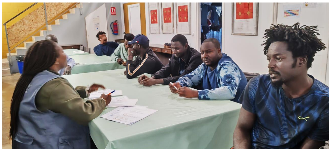
Fotografía 12. Formación en Cuidado del Hogar en Alojamiento Colectivo de ASNUCI

El modelo de alojamiento gestionado por ASNUCI se consolida como referencia en la provincia de Huelva, demostrando que la autogestión y la economía social pueden ofrecer respuestas dignas, sostenibles y replicables frente al sinhogarismo migrante.