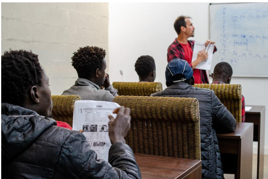
Fotografía 8. Voluntario impartiendo clases de Lengua y Cultura Española en el aula del Centro de Día de ASNUCI 30.04.2024.

El voluntariado constituye uno de los pilares humanos de ASNUCI, promoviendo la solidaridad recíproca entre personas migrantes y autóctonas y fortaleciendo la dimensión comunitaria del proyecto.