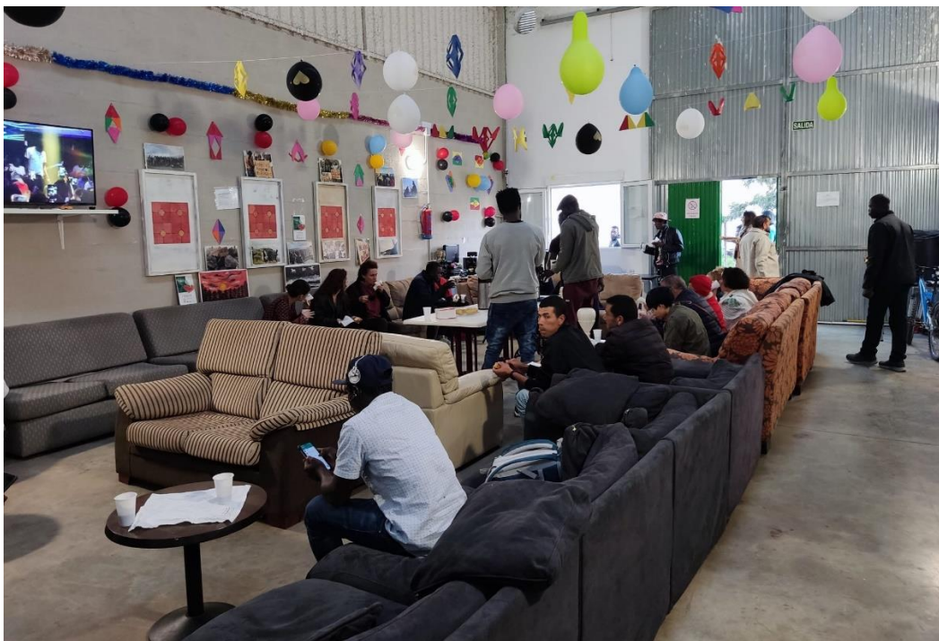
Fotografía 3. Convivencia de navidad en el Centro de Día de ASNUCI 2022.