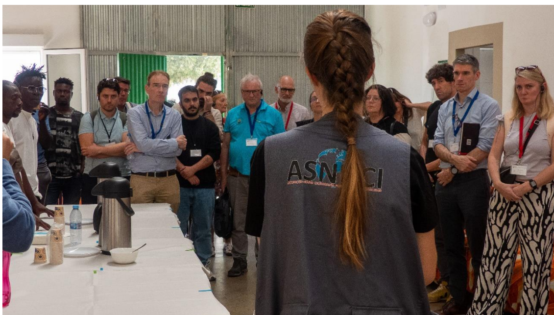
Fotografía 22. Trabajadora social de ASNUCI explicando el recurso del Centro de Día a personas visitantes en el marco del proyecto SafeHabitus 22.10.2024.

Estas dinámicas reflejan un modelo de autogestión participativa, en el que las personas migrantes son parte activa en la toma de decisiones y en la construcción colectiva del proyecto social.