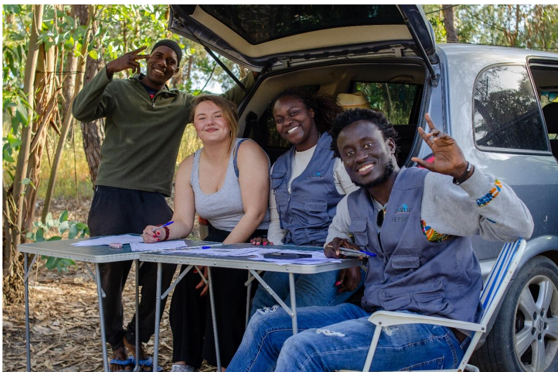
Fotografía 13. Personal técnico, voluntaria y usuario en asentamiento Lucena del Puerto (Huelva) 25.04.2024.

En conjunto, el Programa ADÚ ha superado ampliamente los objetivos previstos, consolidándose como una intervención de referencia en la provincia de Huelva en materia de atención a personas migrantes en situación de exclusión residencial. Su enfoque integral, comunitario y en red impulsa la dignidad, la inclusión y los derechos humanos desde la acción local.