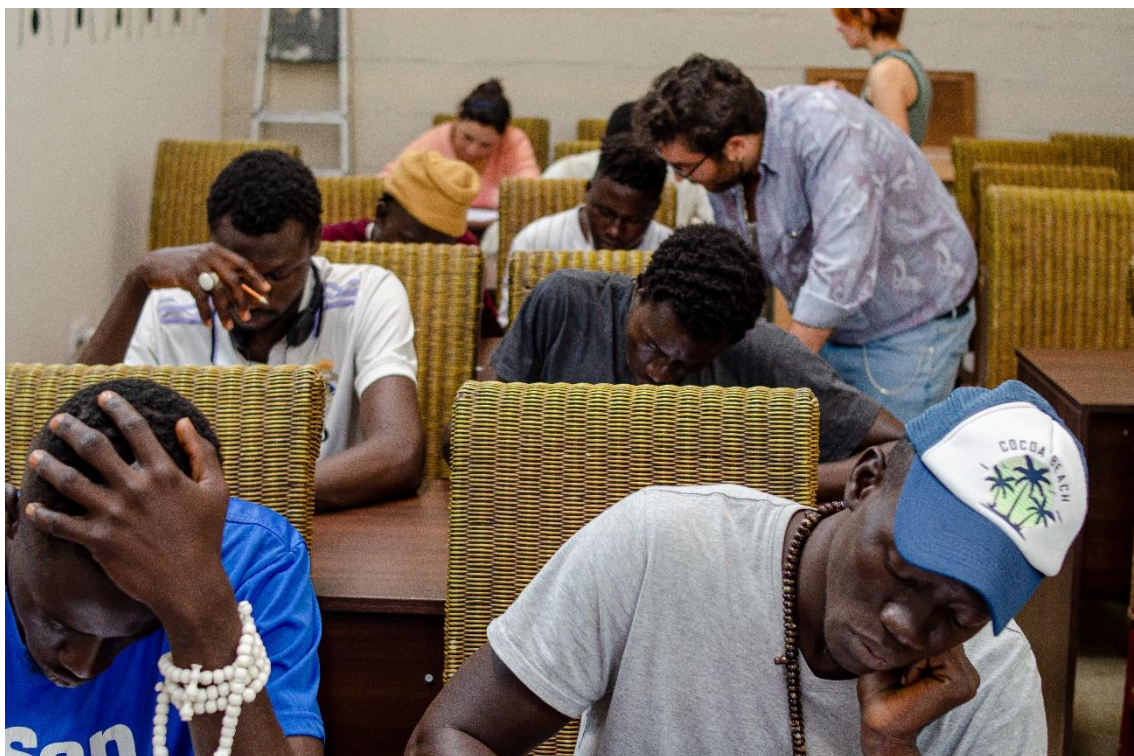
Fotografía 21. Personal voluntario realizando la evaluación inicial de la formación en lengua y cultura española a personas usuarias 17.04.2024.