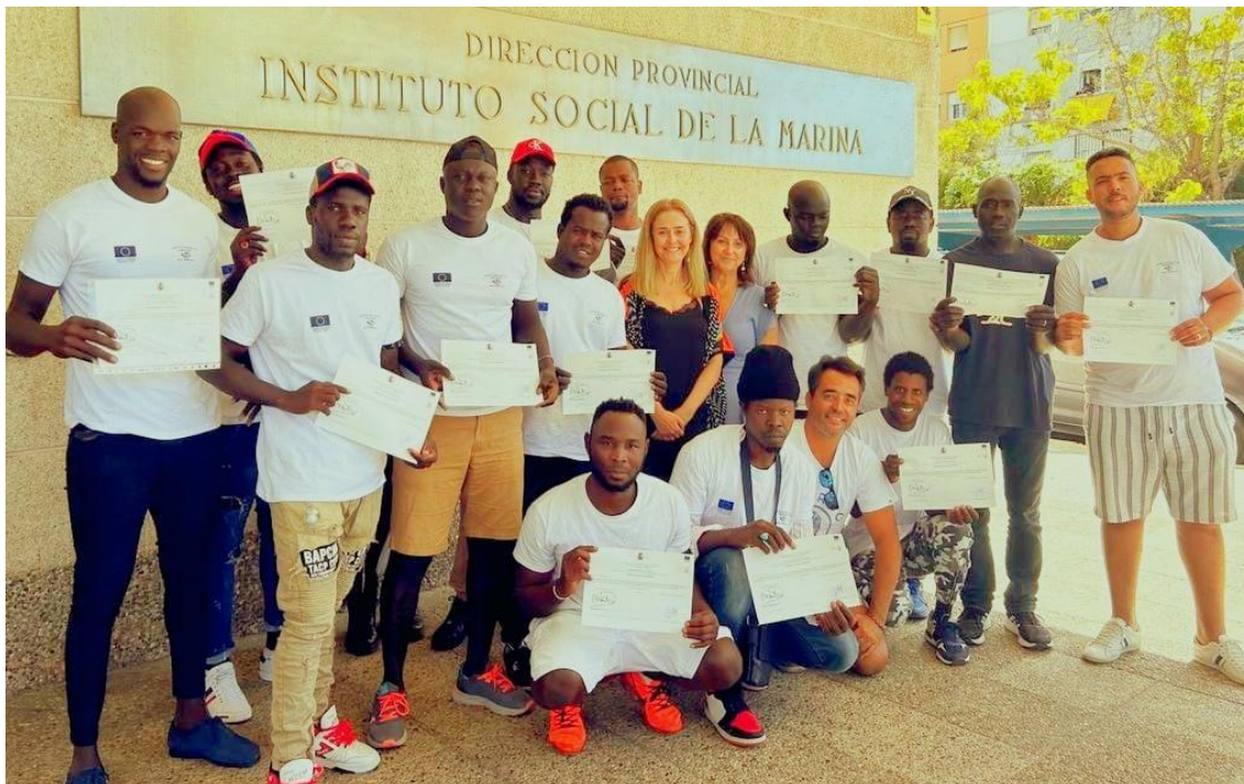
Fotografía 16. Primer grupo de marineros usuarios de ASNUCI beneficiarios del Arraigo para la Formación en el ISM de Huelva 2023.

Con estas acciones, INCORPORA aspira a favorecer la regularización administrativa y la inserción laboral de personas migrantes, promoviendo su autonomía, el acceso a derechos y la construcción de itinerarios de inclusión sostenibles.